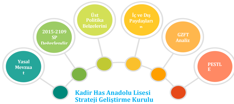
Şekil-1 Stratejik Plan Hazırlık Çalışmaları

Kadir Has Anadolu Lisesi Strateji Geliştirme Kurulu, Millî Eğitim Bakanlığının Şekil-1’de belirtilen Stratejik Planlama Modeline göre; Durum Analizini gerçekleştirmiştir. Geleceğe Yönelim bölümünün tasarlanması, Stratejik Planın yıllık uygulama dilimleri olan performans programının hazırlanması ve uygulama sonuçlarının izlenip değerlendirilmesi Millî Eğitim Bakanlığı Stratejik Planlama Modeli’nin ana hatlarını oluşturmaktadır. Bu kısımda yukarıdaki konular kapsamında Kadir Has Anadolu Lisesi Müdürlüğü’nün 2024-2028 Stratejik Planı’nın oluşturulma sürecine yön veren mevzuat ve program ile çalışma ekipleri ve takvimine değinilmiştir.