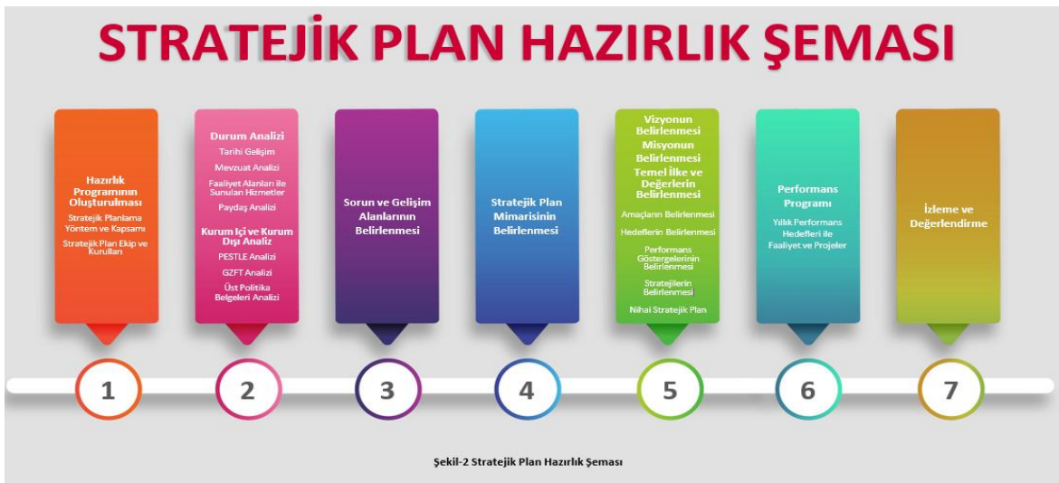
Şekil-2 Stratejik Plan Hazırlık Şeması

Ekip tarafından oluşturulan çalışma takvimi kapsamında ilk aşamada durum analizi çalışmaları yapılmış ve durum analizi aşamasında, paydaşlarımızın plan sürecine aktif katılımını sağlamak üzere paydaş anketi, toplantı ve görüşmeler yapılmıştır. Durum analizinin ardından geleceğe yönelim bölümüne geçilerek Okulumuzun amaç, hedef, gösterge ve stratejileri belirlenmiştir.